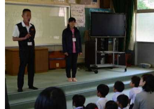
熊本で働く飯田養護教諭

さて、本校では今年度の研究テーマを国語に設定し、子供たちの国語の力を伸ばすことに取り組んでいます。これは、普段の子供たちの様子や学力調査の結果から、本校の児童は、豊かな素晴らしい気持ちや思いはあるが、それを表現することがなかなかできないという実態があるからです。国語の力は、算数や理科、社会の他、すべての学習の基礎といわれています。国語の力、言葉の力があればあるほど、私たちは、物事を深く考え、感性豊かに感じることができるのです。