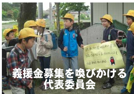
義援金募集を喚びかける 代表委員会

熊本地震の義援金を募集したところ、本校では総額 52,111 円の義援金が集まりました。このお金は、日本赤十字社を通して、熊本県の復興や被災された方々の支援に役立てていただきます。ご協力ありがとうございました。